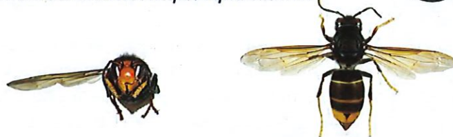
Frelon asiatique à pattes jaunes, Vespa velutina var. nigrithorax

Le frelon asiatique à pattes jaunes, Vespa velutina , est à dominante noire, avec une large bande orange sur l'abdomen et un liseré jaune sur le premier segment. Sa tête vue de face est orange, et les pattes sont jaunes aux extrémités. Il mesure entre 17 et 32mm.