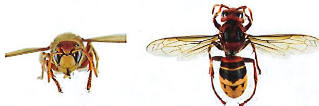
Frelon d'Europe, Vespa crabro

Le frelon d'Europe , Vespa crabro , a l'abdomen à dominante jaune clair, avec des bandes noires. Sa tête est jaune de face et rouge au dessus. Son thorax et ses pattes sont noirs et brun-rouges. Les ouvrières mesurent entre 18 et 23mm et les reines entre 25 et 35.