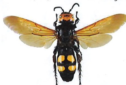
Scolie des jardins, Megascolia maculata flavifrons

La scolie des jardins fait partie des plus imposantes "guêpes" européennes. Elle est de ce fait fréquemment confondue avec le frelon asiatique. Sa pilosité est très épaisse. Son corps est noir brillant, sa tête est jaune sur le dessus et elle possède 4 zones jaunes et glabres sur l'abdomen. C'est un parasite de larves de gros Coléoptères (comme le Hanneçon).