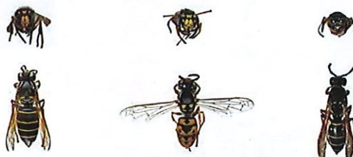
Guêpe des buissons, Dolichovespula media

Les guêpes sont plus petites que les frelons. Les ouvrières mesurent environ 15mm en fin d'été. Attention, une reine de guêpe peut dépasser légèrement 20mm, c'est-à-dire la taille du frelon asiatique représenté ici sans la tête. Au printemps les guêpes peuvent donc être plus grande que les premières ouvrières de frelon.