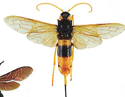
Sirex géant, Urocerus gigas

Le sirex géant est un Hyménoptère dont la larve se nourrit de bois. La femelle peut atteindre 4,5 cm, a une coloration proche du frelon asiatique, mais s'en distingue facilement par des antennes longues entièrement jaunes ainsi que par la présence d'une longue tarière lui permettant de pondre dans le bois. Cet insecte est inoffensif.