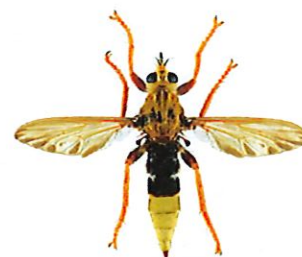
Asile frelon, Asilus crabroniformis