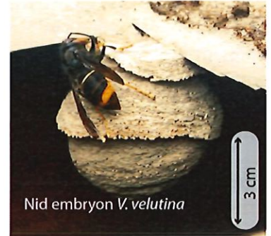
Nid embryon V. velutina

Au printemps, chaque reine fondatrice construit seule son nid dans un lieu souvent protégé. Chez la plupart des guêpes le nid embryon ressemble à une petite sphère de 5 à 10 cm de diamètre avec une ouverture vers le bas. Chez les frelons, la colonie n'hésitera pas à déménager si l'emplacement ne convient plus (manque de place, de sécurité).