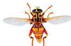
Milésie faux-frelon, Milesia crabroniformis