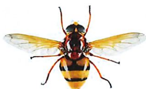
Volucelle zonée, Volucella zonaria

De nombreuses mouches (Diptères) peuvent ressembler à des guêpes ou des frelons. Mais à la différence de ceux-ci elles ne possèdent qu'une seule paire d'ailes au lieu de deux. Leurs yeux sont généralement beaucoup plus globuleux et leurs antennes plus courtes.