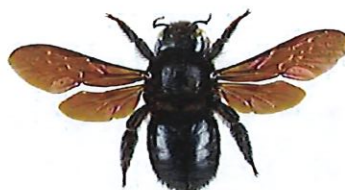
Xylocope ou abeille charpentière, Xylocopa violacea

L' abeille charpentière mesure entre 2 et 3 cm. C'est l'une des plus grandes abeilles européennes. Elle est entièrement noire avec des reflets bleu violacés. Elle construit son nid dans le bois mort et nourrit ses larves de pollen.