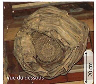
Vue du dessous